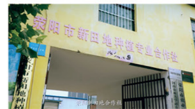
永阳市新田地种植专业合作社

公司以支持农业产业发展为主打条线，支持农业产业链链长和龙头企业发展，支持全产业链发展。