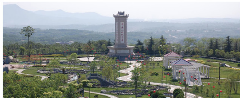
竹林镇“引黄入竹纪念碑”

奋进新时代，砥砺新征程。展望未来，竹林镇将继续坚持“以人为本”，不断完善提升以党建引领基层共治、共建、共享的新时代乡村治理新体系，以新理念担当新使命，以新作为实现新目标，以新实践创造新经验，努力为国家治理体系和治理能力现代化建设作出应有贡献！