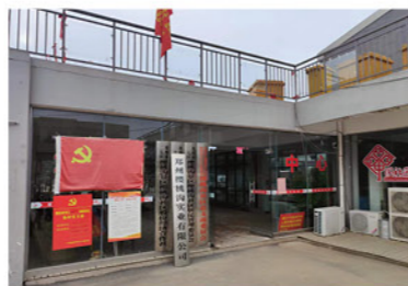
财政补贴建设的农业项目发展

郑州市二七区樱桃沟村是国家、省、市支持建设的美丽乡村，郑州樱桃沟实业有限公司成立于2015年11月25日，作为樱桃沟村集体全资企业，2021年郑州“7·20”水灾导致园区设施全部被冲毁，淤泥覆盖。园区整体重新投资建设，公司及时提供200万元担保贷款支持，使其在2022年五一假期前开园营业。园区2022年运营半年收入超过600万元。