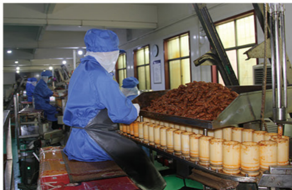
龙祥食品厂生产线

如今热闹的田庄村，几年前却是另外一番景象。田庄村共有1900多口人，“靠天吃饭，靠地穿衣”是