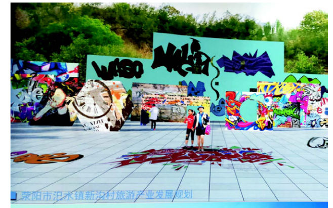
以大学生写生基地为中心，创建西部中原文化涂鸦城

2020年，新沟村与郑州市新沟生态农业有限公司合作，把大学生写生基地进一步提升为党性教育基地，发展红色文化旅游产业。该项目已经初具规模，待项目完全建成后，新沟村村集体经济收入、建档立卡贫困户就业、巩固提升脱贫成效等方面将得到较大改观。