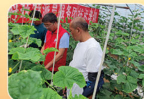
市蔬菜产业科技特派员服务团赴登封开展瓜菜新品种新技术展示培训会