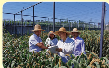
郑州市农林科学研究所旱作实验室支部进行田间实验调查