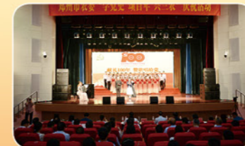
2021年6月25日郑州市农委“学党史 颂百年 兴三农”庆祝活动