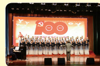
2021年6月25日郑州市农委组织“献礼100年，赞歌唱给党”歌咏比赛