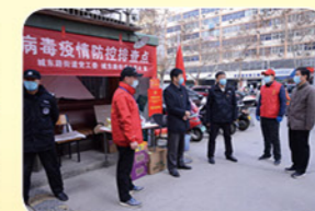
2020年2月农委党员志愿者在城东路下沉点值守