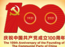
庆祝中国共产党成立100周年 The 100th Anniversary of the Founding of The Communist Party of China