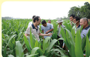
农业技术推广中心党员在田间进行玉米高产栽培技术指导