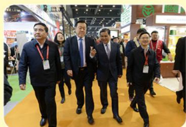
农业农村部副部长于康震河南省人民政府副省长武国定出席中国绿博会开幕式

前言：市农委党建工作在委党组的坚强领导下，以“坚持‘五个带头’创建模范机关”为目标，以提升组织力为重点，突出政治功能，压实党建责任、强化制度落实、注重融合聚力，不断探索基层党组织规范化建设有效途径，着力打造推动“三农”工作高质量发展的坚强战斗堡垒和先锋队。