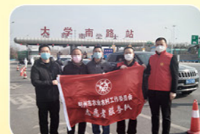
2020年2月农委党员志愿者在大学南路高速卡口值守