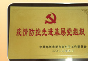
2020年5月，被郑州市直机关工作委员会授予疫情防控先进基层党组织