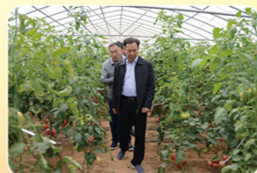
郑州市副市长李喜安到新郑市调研