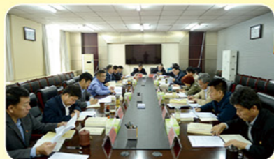
2020年1月市农委党组学习基层组织工作条例