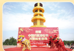
2018年9月23日首届农民丰收节