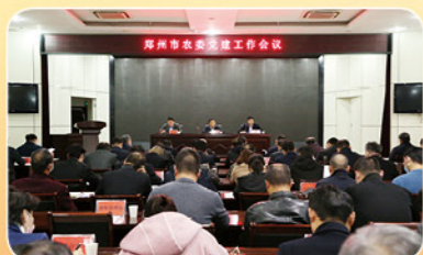
2021年4月2日郑州市农委党建工作会议