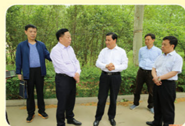
武国定副省长调研指导郑州黄河湿地建设工作