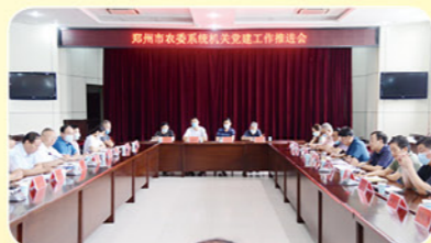
2020年8月4日郑州市农委召开党建工作推进会