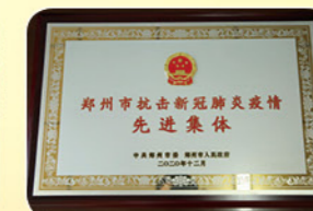
2020年12月，被郑州市委、郑州市人民政府授予郑州市抗击新冠肺炎疫情先进集体