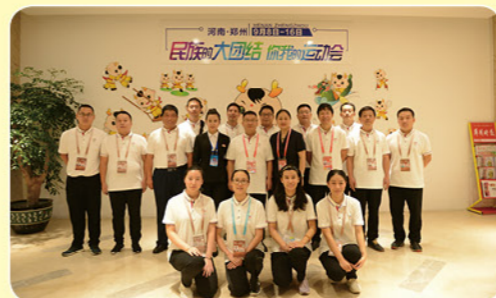
2019年8月民族运动会保障

各级党组织在党委组的领导下，高擎党旗筑堡垒，带领广大党员干部坚持“五亮”标准，积极投入新冠疫情防控，优化营商环境等重点工作任务中。