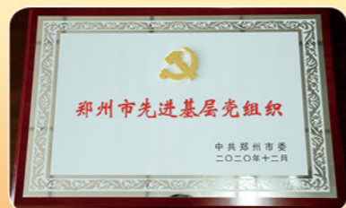
2020年12月郑州市委授予市农委直属机关党委“先进基层党组织”