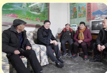
河南省委常委、郑州市委书记徐立毅在新密与贫困户亲切交谈