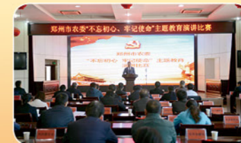
2019年11月13日市农委“不忘初心 牢记使命”主题教育演讲比赛