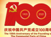
庆祝中国共产党成立100周年 The 100th Anniversary of the Founding of The Communist Party of China