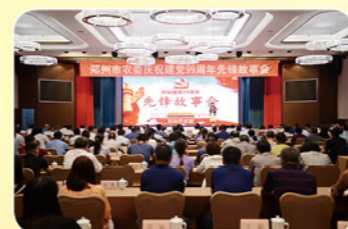
2020年6月23日市农委庆祝建党99周年先锋故事会