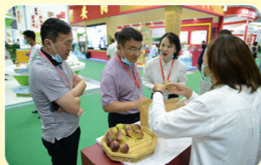
2020年9月6日驻马店第二十三届中国农洽会