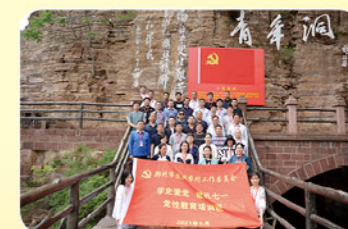
2021年5月市农委组织党员干部到红旗渠学习培训