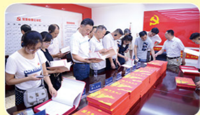
2018年8月3日郑州市农委组织部开展党建示范点学习观摩活动

围绕规范支部建设，认真落实党内法规制度，做到按法规落实，依制度运行，组织生活制度落实逐步规范，基层党组织建设规范化、标准化程度不断提高。