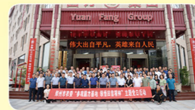
2020年7月14日农委机关党员开展以“参观圆方基地 领悟回信精神”为主题的党日活动

增强主题党日的政治性、教育性，做到“有规矩、有灵魂，有内容、有党味、有效益”，让党员从中得到锻炼、受到熏陶，进一步增强对党的认同感、归属感，党组织的组织力、凝聚力、号召力得到增强。