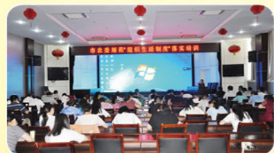
2019年8月直属机关党委开展“组织生活制度”落实培训