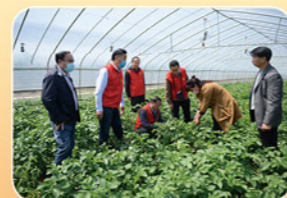
2020年4月24日市农委到登封市李窑村技术服务