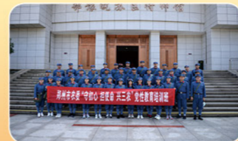
2020年9月市农委组织党员干部到大别山学习培训