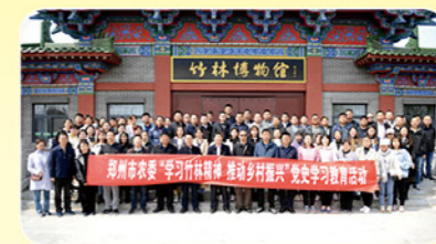
2021年3月25日市农委党员干部赴巩义开展“学习竹林精神，推动乡村振兴”党史学习教育活动