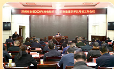
2021年1月15日郑州市农委2020年度党组织书记抓党建述职评议考核工作会议