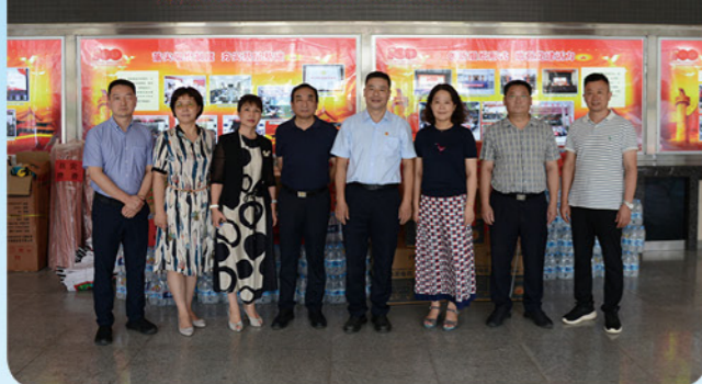
“风雨同舟 并肩携手”防汛抗灾救援物资 郑州市农委 建行郑州金水支行