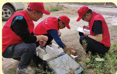
郑州市农业综合行政执法支队开展养殖环节和屠宰环节“瘦肉精”监测抽检工作