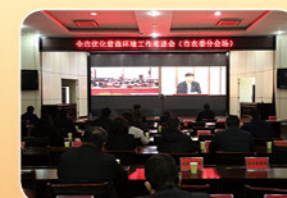
2021年2月23日全市优化营商环境工作推进会