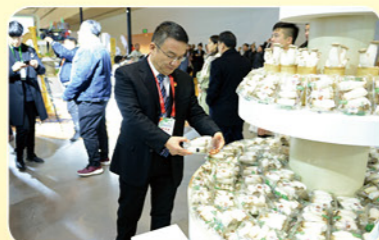
2019年11月29日第二十届中国绿色食品博览会暨第十三届中国国际有机食品博览会开幕