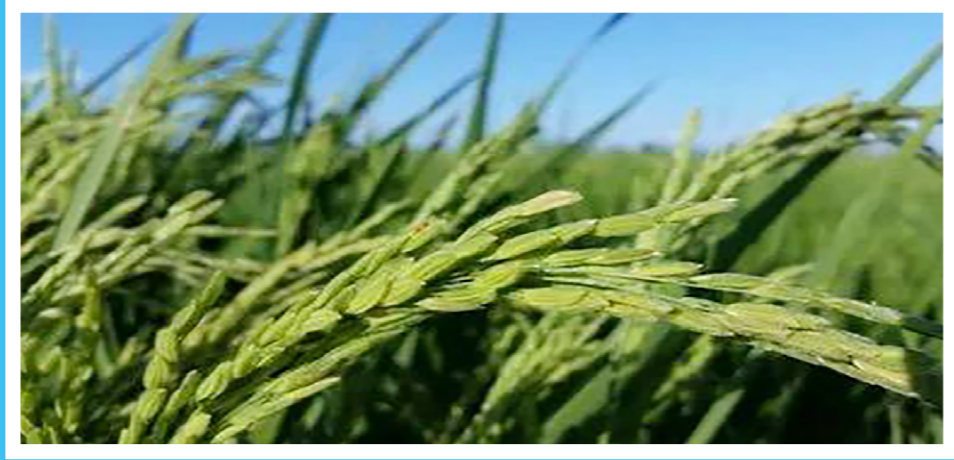
河南众富农业科技有限公司 量子水稻