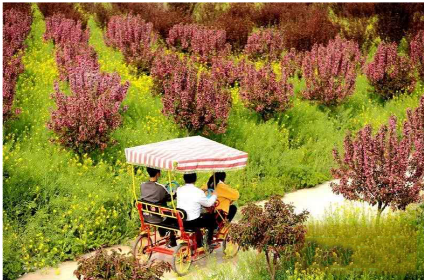
海棠花旅游观赏基地

“竹以直为美、人以正而尊、党以廉而强”。新沟村党员干部通过参加大别山红色培训、“七一”重温入党誓词、向烈士陵园敬献花篮等系列活动，起到洗礼心灵、凝聚共识、强化党性的目的，新