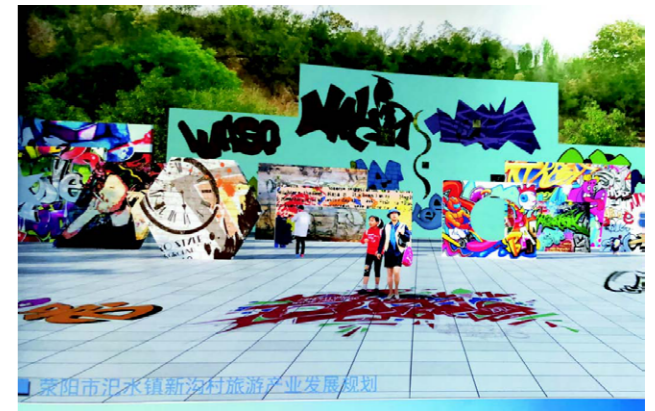
以大学生写生基地为中心，创建西部中原文化涂鸦城

2020年，新沟村与郑州市新沟生态农业有限公司合作，把大学生写生基地进一步提升为党性教育基地，发展红色文化旅游产业。该项目已经初具规模，待项目完全建成后，新沟村村集体经济收入、建档立卡贫困户就业、巩固提升脱贫成效等方面将得到较大改观。