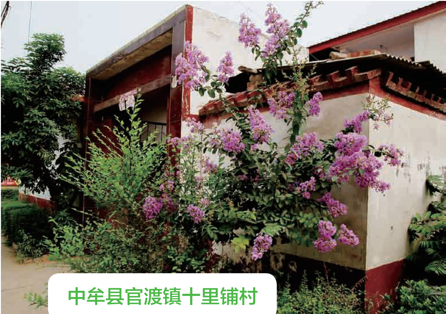
中牟县官渡镇十里铺村

官渡镇十里铺村紧邻310国道，距市中心35公里，交通便利。全村共有349户，1422口人，耕地面积1634亩，人均耕地1.14亩。