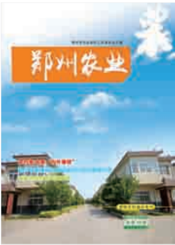
本期封面：新密市米村镇于湾村 协办单位：新农村建设办公室