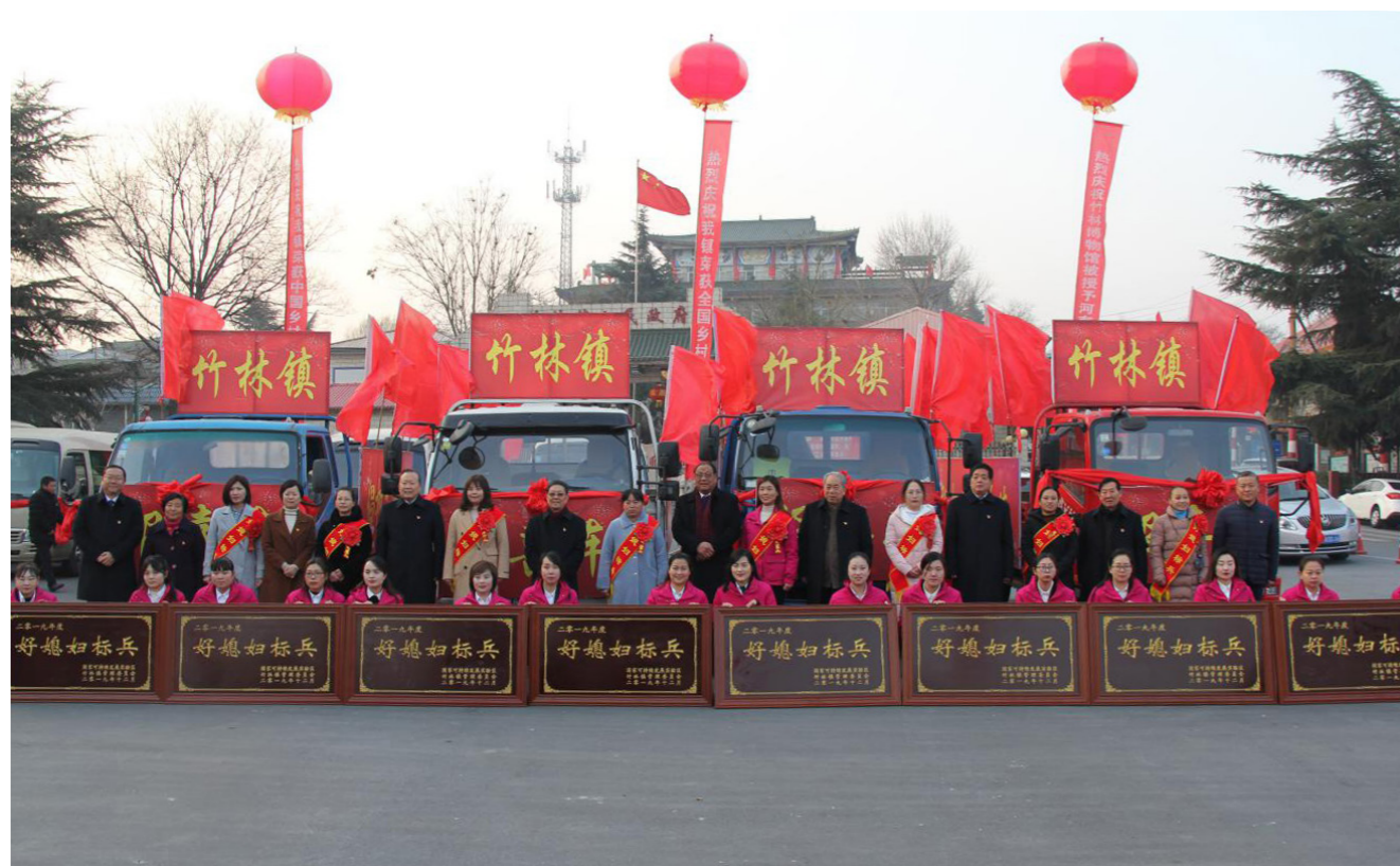
竹林镇“好媳妇标兵”评选

奋进新时代，砥砺新征程。展望未来，竹林镇将继续坚持“以人为本”，不断完善提升以党建引领基层共治、共建、共享的新时代乡村治理新体系，以新理念担当新使命，以新作为实现新目标，以新实践创造新经验，努力为国家治理体系和治理能力现代化建设作出应有贡献！