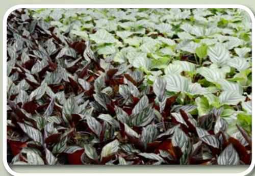
双线竹芋和青苹果竹芋