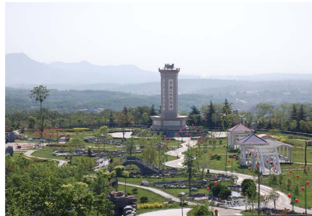
竹林镇“引黄入竹纪念碑”

竹林镇经常组织开展群众喜闻乐见、丰富多彩的文化娱乐活动，并将社会主义核心价值观融入其中。每年在重要节日，都要邀请剧团为群众唱大戏，精心挑选那些能够体现优秀传统美德和弘扬时代精神的戏曲，寓教于乐，推动移风易俗。连续举办二十二届“文化艺术节”、八届“重阳节孝老敬亲活动”，营造尊老、敬老、爱老、助老的浓厚氛围。特别是每年孝老敬亲活动，重阳节当天，全镇80岁以上的老人由晚辈抬花轿送到长寿山孝拜广场接受晚辈跪拜大礼。孤