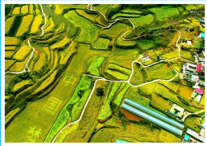
新密市袁庄乡乱石坡村